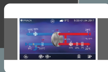
Kolorowy, dotykowy wyświetlacz